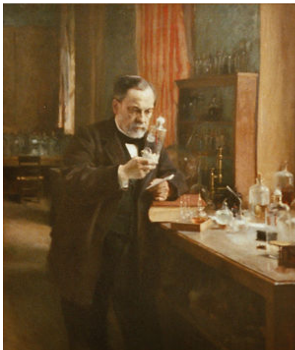
Ilustração 1 Louis Pasteur no seu laboratório

Com esta experiência engenhosa, Pasteur também demonstrava que o líquido não havia perdido na fervura as suas propriedades de abrigar vida, como argumentaram alguns de seus opositores. Além disso, não se podia alegar a ausência do ar, uma vez que este entrava e saía livremente.